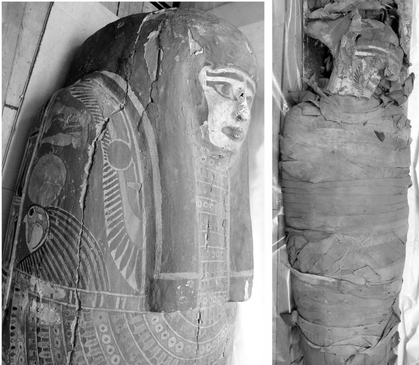
FIGURAS 6 y 7. Sarcófago exterior de madera de Isis-weret (izquierda) y cuerpo momificado con probable máscara funeraria, sin alteraciones de sus vendajes (derecha) (Nos 6229 y 6230) (Fotos 2007). Al parecer el sarcófago, la máscara y la momia, correspondan a la misma persona.