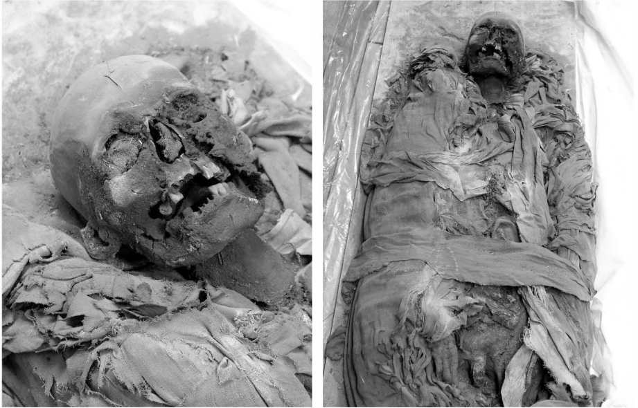
FIGURAS 4 y 5. Detalle del cráneo y cuerpo momificado con vendajes en gran parte retirados, que se halla al interior de los sarcófagos de la identificada por Mostny como Heri-wedjat (Nº 6231) (fotos 2007). Por sus características físicas, corresponde a un individuo masculino.