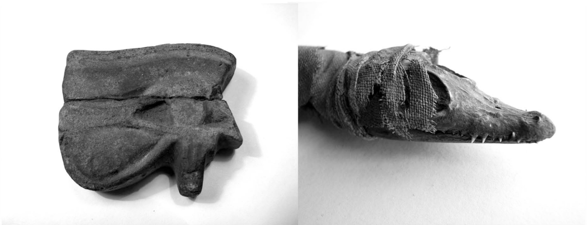
FIGURAS 10 y 11. Ojo de Horus (N° 2349), loza (izquierda). Detalle del cráneo de la cría de cocodrilo momificado, envuelto con textil (N° 2335); corresponde a un cuerpo completo (derecha) (Fotos 2007).