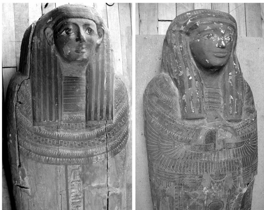
FIGURAS 2 y 3. Sarcófago exterior de madera (izquierda), y sarcófago interior de cartonaje (derecha), según Mostny de Heri-wedjat (Nos 6232 y 6236) (fotos 2007); pertenecen a un individuo femenino.

Aunque será motivo de trabajos posteriores, los 30 objetos de la colección, registrados en el libro de inventario (antiguo) N° 1: 138-143 del Área de Antropología, constan de figurillas de dioses (cerámica, piedra y metal), escarabajos de piedra, lámparas de cerámica, colgantes, otra clase de amuletos (Figura 10) ya que los escarabajos también lo son-, esfinges pequeñas de metal y cerámica, collares, adornos, un trozo textil de envoltura de una momia, “2 ejemplares (imita momias)” (N° 2331), imitación de una momia egipcia (N° 2319), un “ cocodrilo nuevo momificado de la caverna de Maabda ” (N° 2335) (Figura 11), junto a otros elementos.